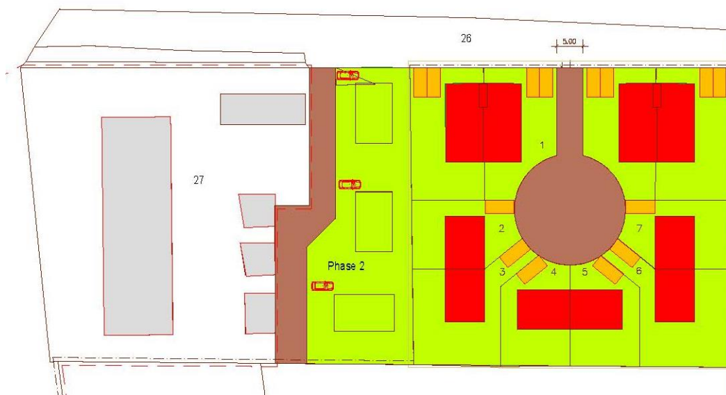
Schematische Darstellung der geplanten Nutzung; Planungsbüro Michael Gipp

Die Anordnung der Häuser im Plangebiet soll an eine Hofsituation erinnern. Diese passt sich der in der Umgebung bereits vorhandenen baulichen Situation von größeren Hofkomplexen an. Die Erschließung der zukünftigen Häuser ist durch die Straße Wiesengrund gewährleistet.